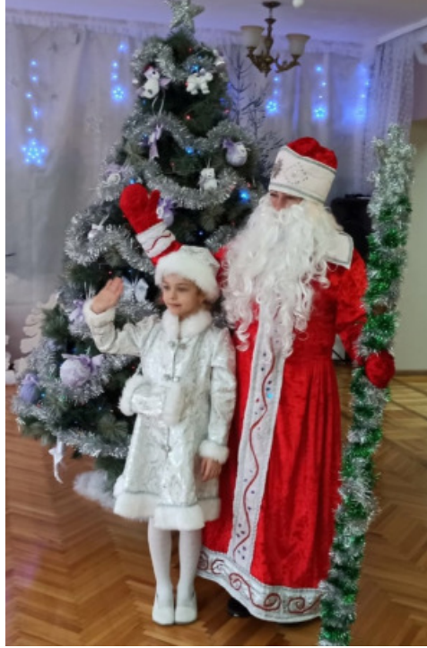
Дед Мороз просыпается под елкой и подходит к Снегурочке

ЮПИД: Правила Дорожного Движения! 1-Дорогу если надо перейти, Ты голову налево поверни! 2- Теперь, конечно же, ты посмотри направо! Всё это так несложно, право! 3-И если опасности нет ... То двигайся вперед, вот наш совет!